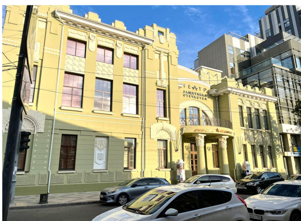
Рисунок 1 – Театр «Защитника Отечества» в г. Краснодар.

В качестве примера положительного влияния реконструкции, хотелось бы привести Театр «Защитника Отечества» в городе Краснодар, Краснодарский край (рис. 1).