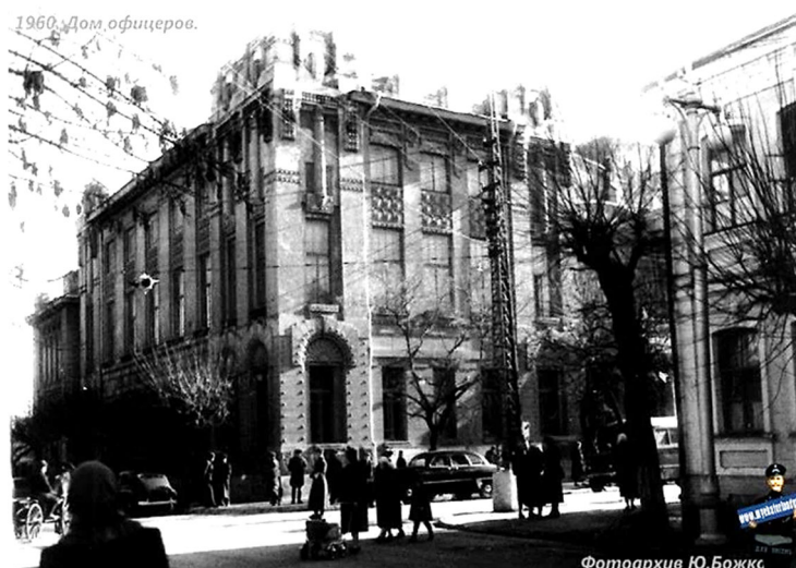
Рисунок 3 – Дом офицеров. Фотооткрытка, 1960 год.

Из всего вышесказанного можно сделать вывод, что реконструкция культурно-исторических зданий необходима. Она позволяет сохранить исторический образ города [5], полезные площади, а также улучшить и модернизировать показатели объектов, без сноса и постройки на их месте нового.