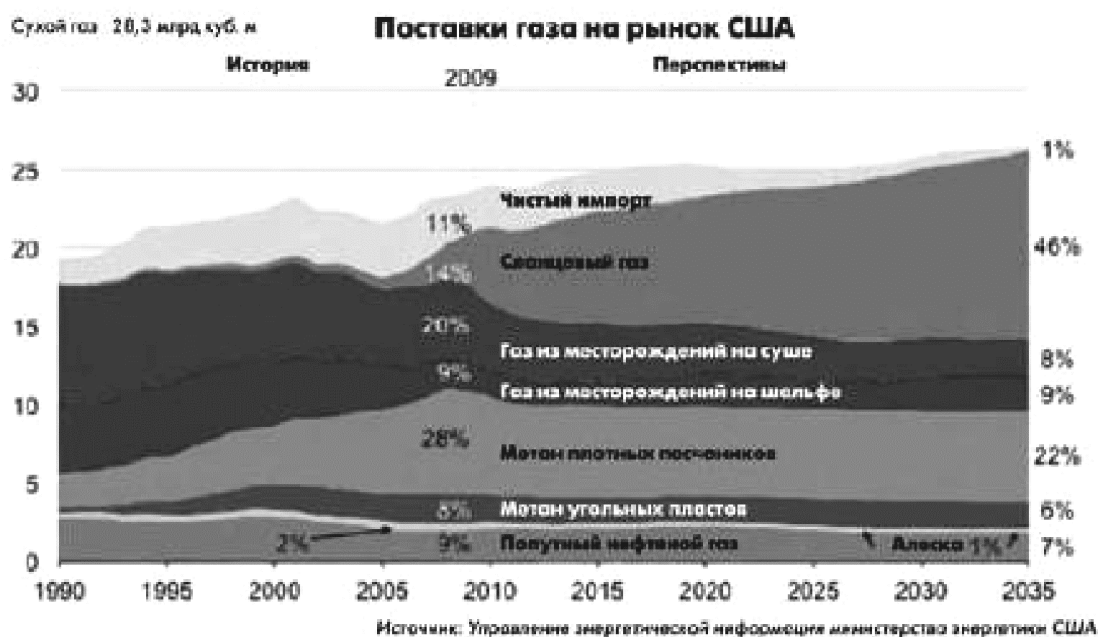
Рисунок 2 – Поставки газа на рынок США

Геополитические последствия этой «смены парадигмы» видятся авторам доклада следующим образом. Будет снижена зависимость США от импорта дорогого СПГ, сократится дефицит внешнеторгового баланса. Кроме того, более широкое использование природного газа снизит американские выбросы парниковых газов, а поставки американского газа на экспорт усилят конкуренцию производителей энергоресурсов на глобальных рынках, что положительно отразится на ценах. Увеличение поставок американского газа на мировой рынок сократит потенциальную угрозу со стороны формируемой «газовой ОПЕК» (форума стран-экспортёров газа, ФСЭГ) и ослабит энергетическое влияние в мире таких стран, как Россия, Венесуэла и Иран. Эти страны будут ограничены в возможностях применять «энергетическое оружие» и использовать «энергетическую дипломатию» в противовес интересам США на мировой арене. В частности, роль сланцевого газа на мировых рынках проявится в том, что ослабнут рычаги влияния России на Европу – поставки российского газа на европейские рынки упадут до 13 % (на пике в 2007 году они составляли 26 %).