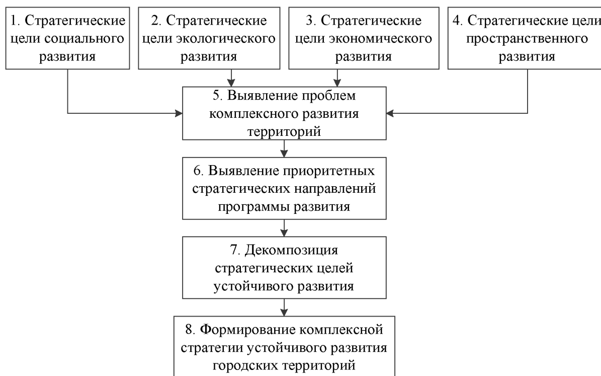
Рисунок 1 – Последовательность формирования стратегических целей устойчивого развития урбанизированных территорий

Все приведенные соображения легли в основу разработанной принципиального алгоритма формирования стратегических целей устойчивого развития урбанизированных территорий (рис. 1).