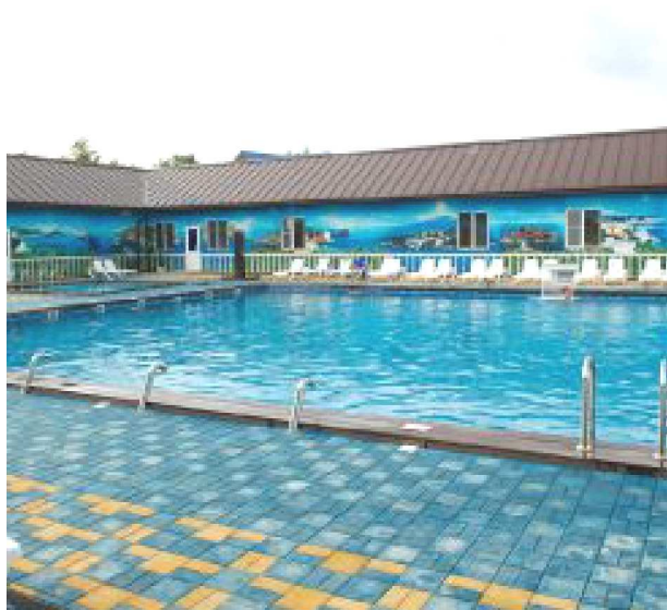
Рисунок 5 – База «Старая Мельница»

тре п. Мостовском. За последние годы они растут как грибы, привлекая многочисленных отдыхающих. Все базы оборудованы бассейнами с термальной водой. Ее температура колеблется от плюс 35 до 50 °С. На территории баз, как правило, расположено несколько рукотворных водоемов с водой разной температуры. База «Аква-Вита» может похвастаться системами гидромассажа, а на базе «Жень-Шень» можно плескаться круглые сутки. На базе «Хуторок» при желании окружающих, можно пожарить шашлыки, отдохнуть в деревянных домиках, перекусить в кафе или порыбачить. Очень уютная и комфортная база «Старая Мельница» шикарным бассейном, из которого можно сразу войти в кафе, выпить чашечку кофе или прохладительные напитки (рис. 5). В лесном массиве спрятана база «Кордон» успешно работающая уже ни один год и имеющая многочисленных клиентов из разных уголков страны.