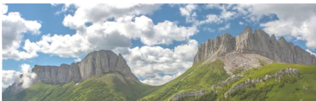
Рисунок 3 – Тхачский массив – Чертовы ворота[4]