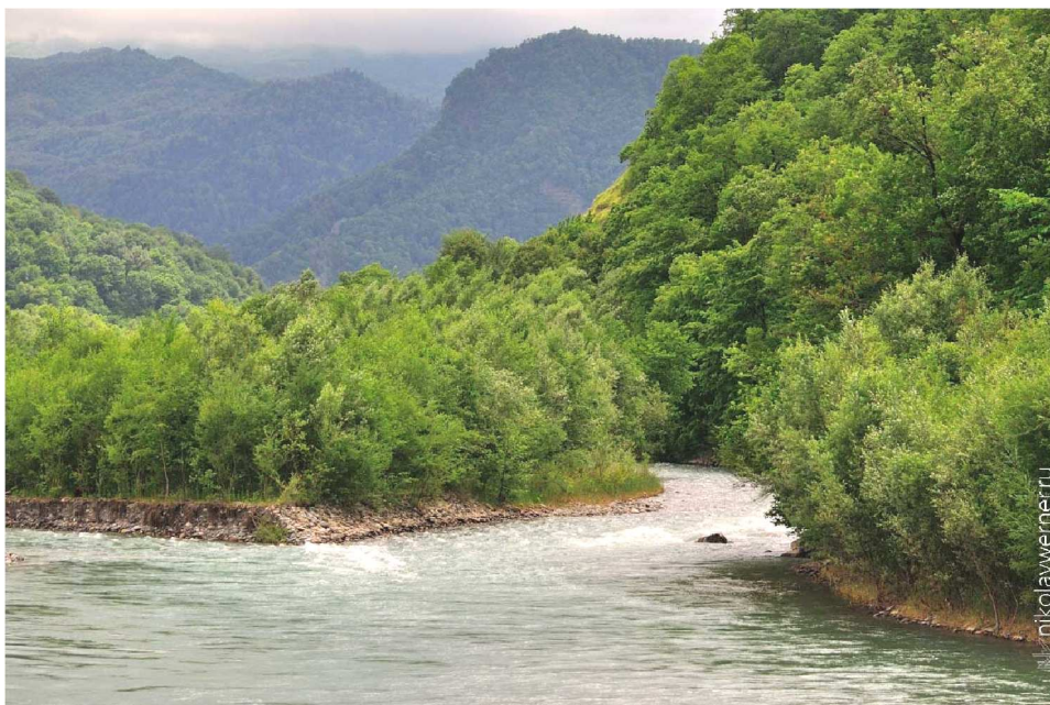
Рисунок 4 – Река Малая Лаба [4]

Окрестности Псебая облюбовали и спортсмены велосипедисты. Здесь проводятся этапы лично-командного чемпионата Краснодарского края по велоспорту в дисциплине маунтинбайк. Регулярно проводятся соревнования по рафтингу, как среди профессионалов, так и любителей.