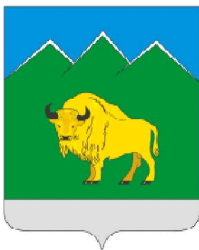
Рисунок 1 – Герб Мостовского района Краснодарского края

Во все времена и все народы мира умели ценить окружающую их природу. Старались селиться около красивых, комфортных для проживания мест. Чтобы рядом была река, или какой либо водоем, лес, горы, богатые разнотравьем луга. Такие места воспевали в песнях, легендах, эпосах разных народов, а позже описывали в книгах, отражали в живописи, фотографиях и фильмах. К таким уникальным местам относится практически вся территория Мостовского района, расположенного в юго-восточной части Краснодарского края.