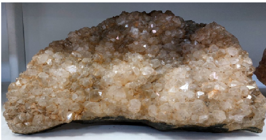
Рисунок 2 – Кальцит