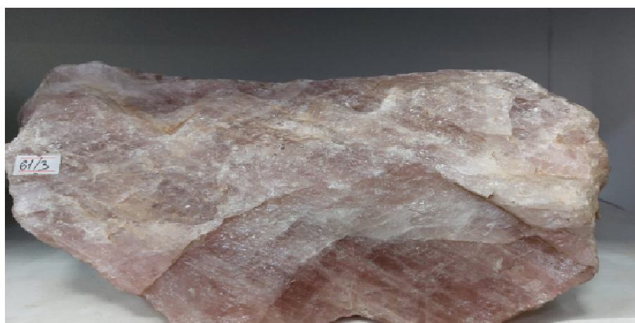
Рисунок 1 – Кварц