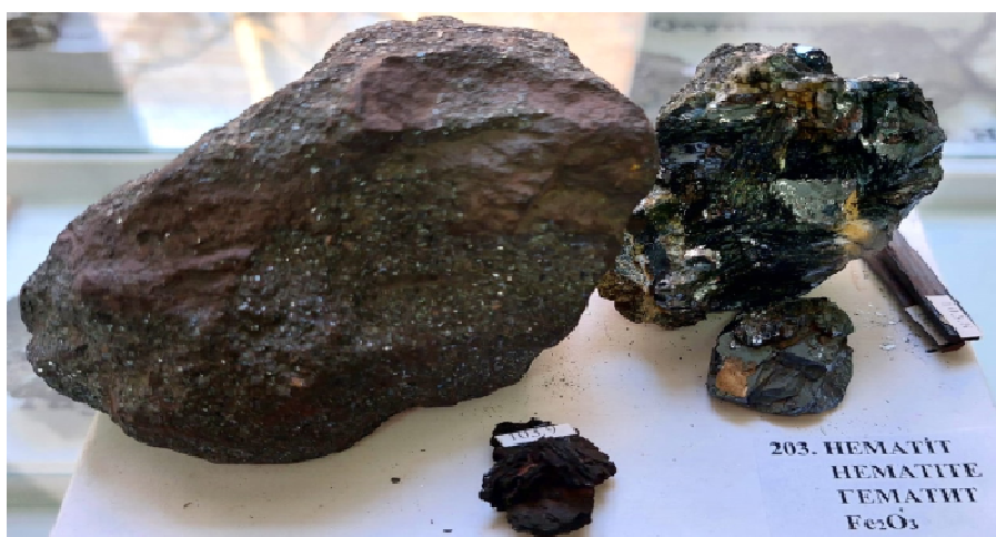
Рисунок 3 – Гематит

Как известно, под воздействием атмосферных осадков, изменений температуры, жизнедеятельности органического мира и других факторов, участвующих в процессах эрозии, горные породы непрерывно разрушаются и разваливаются. Конечно, коренные золотые месторождения, их проявления и зоны минерализации, которые находятся в этих породах, также подвергаются этим процессам. Их разрушение сопровождается разрушением менее устойчивых минералов. Обломки пород, глинистые продукты, кварцевые зерна и другие устойчивые минералы переносятся водными потоками в нижние части рельефа. В процессе такого переноса эти минералы разделяются по их плотности. Относительно тяжелые минералы, включая золото, собираются в основном в нижней части наносов. В результате формируется золотая россыпь. Для такого процесса формирования минералы должны обладать высокой плотностью, химической стабильностью в зоне эрозии и физической долговечностью. Именно золото обладает этими характеристиками, так как его плотность составляет от 15,6 до 19,3. Кроме золота, в такие россыпи могут попадать минералы с высокой плотностью, такие как Pt – платина, HgS – киноварит, (\text{FeMn})\text{Nb}_6\text{O}_2 – колумбит, вольфрамит – (\text{FeMn})\text{WO}_4 , \text{SnO}_2 – касситерит, магнетит – \text{FeFe}_2\text{O}_4 , алмаз – C и другие.