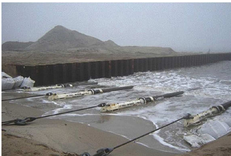
Рисунок 2 – Траншея для береговых трубопроводов проекта «Сахалин-2»

При этом ширина траншеи зависела от возможностей оборудования, производящего подготовку траншеи и укладку трубопроводов, и от диаметра укладываемых трубопроводов (табл. 3).