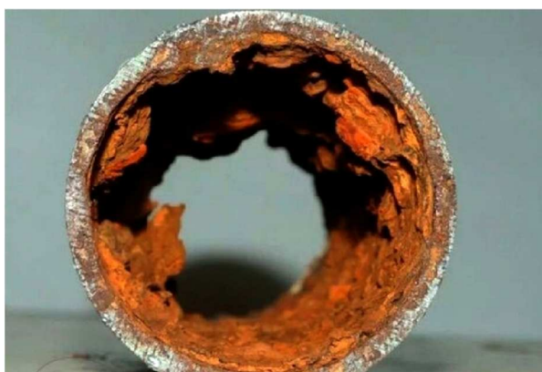
Рисунок 2 – Коррозия как следствие воздействия сероводорода

Коррозия – процесс разрушения материалов вследствие физико- химического взаимодействия с внешней средой. Ввиду коррозии сокращается срок службы нефтегазового оборудования, возникают аварийные разливы нефти, а также к загрязнению окружающей среды.