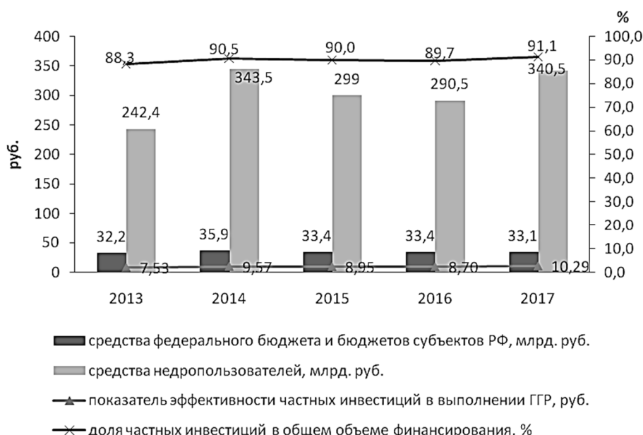
Рисунок 1 – Динамика затрат на геологическое изучение недр и воспроизводство минерально-сырьевой базы РФ в 2013–2017 гг., млрд руб.; составлено автором по данным [2]

Более существенным стало сокращение бюджетного финансирования расходов на геологическое изучение недр и воспроизводство твердых полезных ископаемых (ТПИ), начиная с 2015 года (рис. 2). При этом средства недропользователей увеличились, так их доля в 2017 году достигла 86,9 % в общем объеме финансирования, против 80,4 % в 2013 году. Это свидетельствует об эффективности распределения участков недр для целей геологической разведки по заявительному механизму. Следует отметить, что рост расходов из внебюджетных источников, в первую очередь, обусловлен увеличением финансирования работ на цветные металлы, а в меньшей степени – на черные металлы и угли. Растет и показатель эффективности частных инвестиций в ГПР в ТПИ (6,64 руб. частных инвестиций на 1 руб. бюджетных в 2017 году, против 4,1 руб. – в 2013 году).