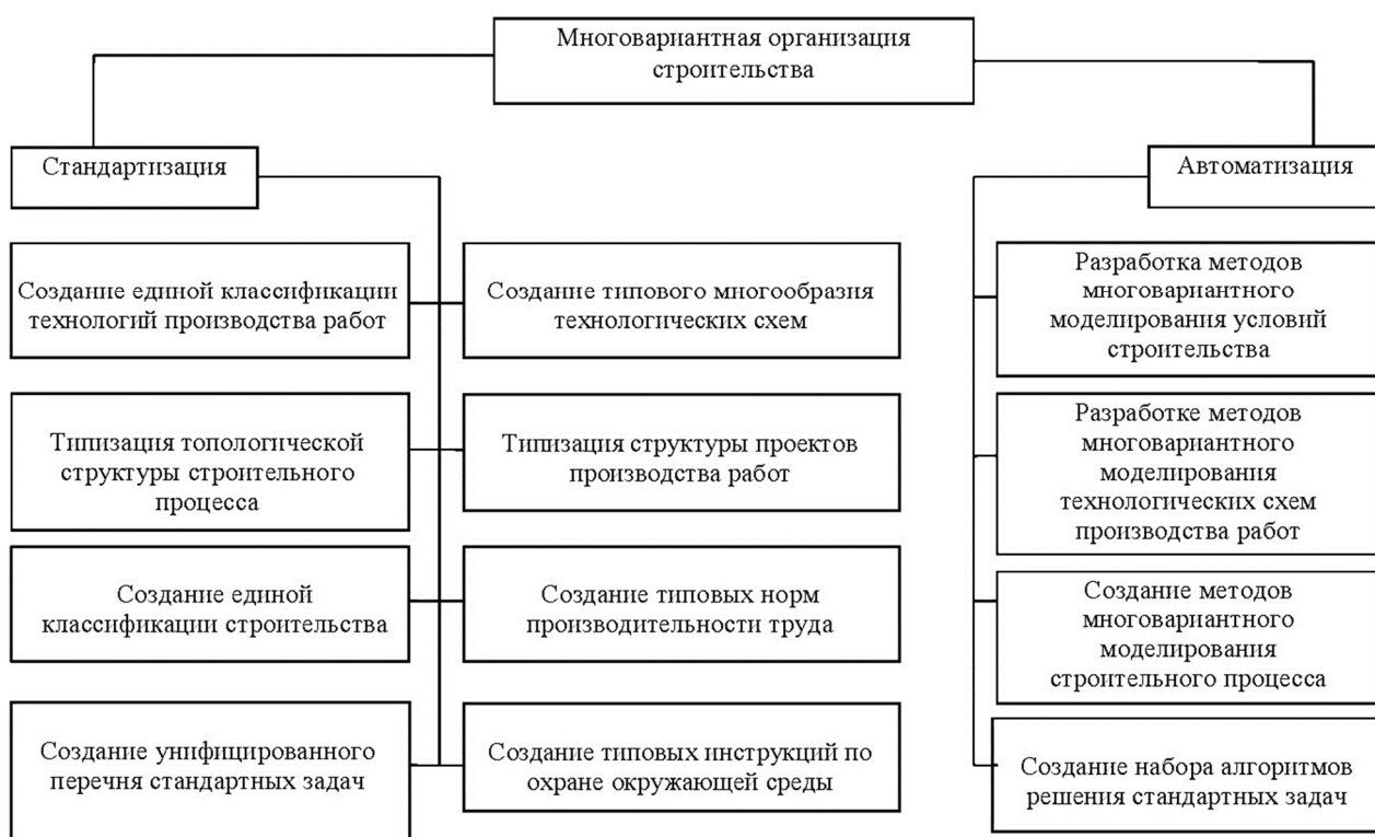
Рисунок 2 – Основные аспекты создания системы принятия многовариантных организационных, технологических и управляющих решений по строительству (ремонту) систем трубопроводного транспорта углеводородов

Вторичная информация является основой корректировки графика выполнения ремонтно-строительных работ.